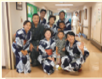
高齢者施設にて盆踊り慰問