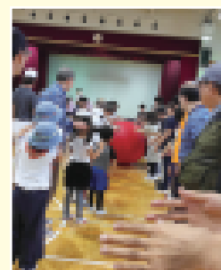
障害者スポーツまつりに参加