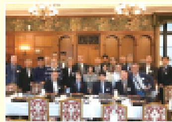
大学同窓会の国会見学 (橋本大臣とご一緒に)