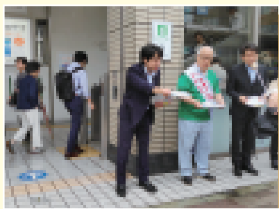
武見敬三候補を応援