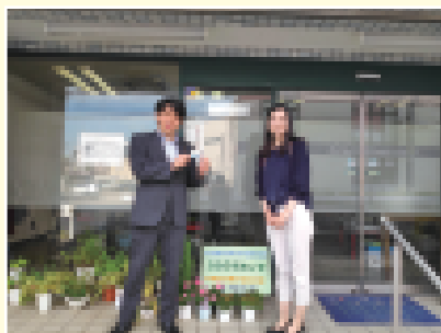
越谷市の作業所を視察