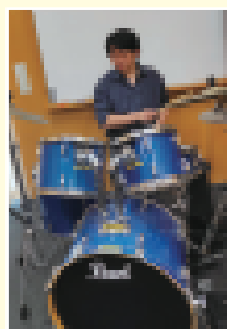
音楽が大好きです！