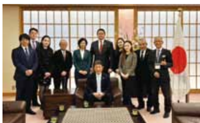
茂木外務大臣表敬訪問 (私はいちばん左)