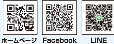
ホームページ Facebook LINE

携帯電話 090-6945-2650 E-mail: tad2720@gmail.com TEL/FAX 042-451-0011 西東京市芝久保町3-5-5-2