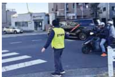
子ども縁日で 警備ボランティア