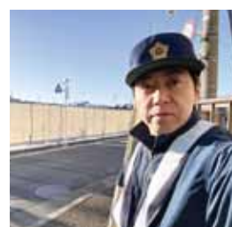
←通学路見守り活動