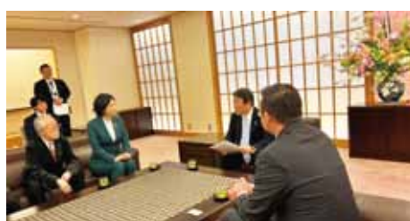
日本・モンゴル友好対談 (私は左三人の真ん中)