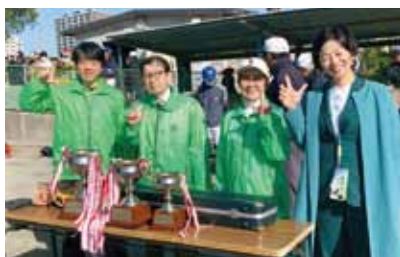
少年野球開会式に出席