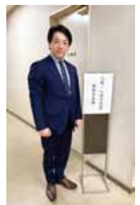
自衛隊入隊激励式に出席