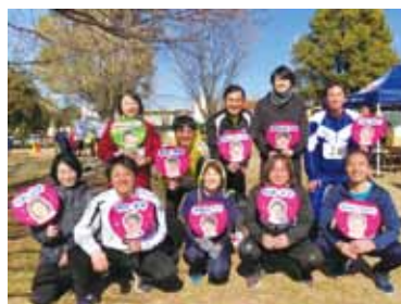
チーム市議会でリレーマラソン!