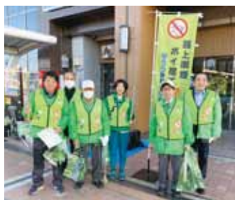
ポイ捨て防止キャンペーン