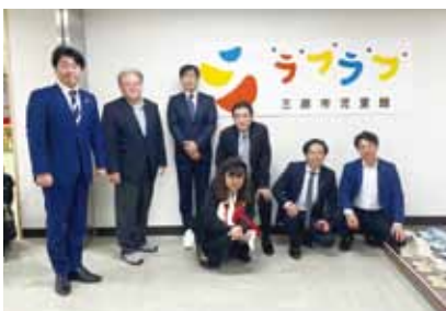
広島県三原市へ会派視察