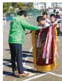
少年野球大会開会式