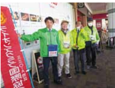
能登半島災害支援募金