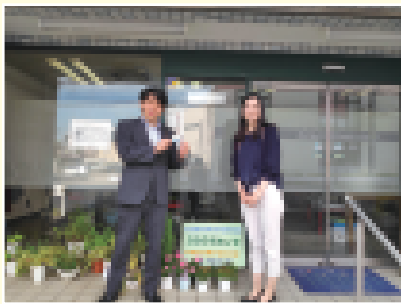
越谷市の作業所を視察