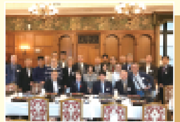
大学同窓会の国会見学 (橋本大臣とご一緒に)