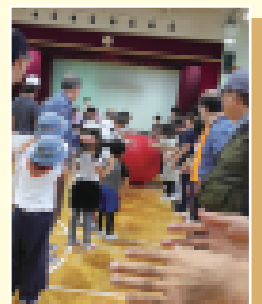
障害者スポーツまつりに参加