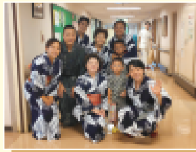
高齢者施設にて盆踊り慰問